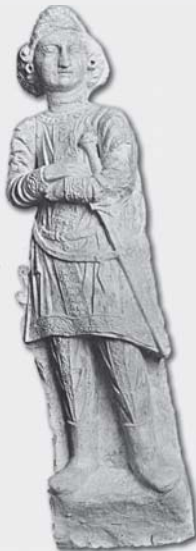
مجسمه‌ای از سنگ آهک مربوط به دوره‌ی اشکانی (قرن دوم میلادی)

پژوهشگران با بررسی آثار باقی‌مانده از روم و ایران باستان دریافته‌اند که این دو بر یکدیگر تأثیر متقابل داشته‌اند. بدین ترتیب، روابط ایران و روم فقط به جنگ‌های دو کشور محدود نمی‌شد و جنبه‌های فرهنگی نیز داشت. ❏ در دوره «اشکانی» اشعار حماسی که شخصیت‌های برجسته‌ی آن زمان را می‌ستود، مورد تشویق قرار می‌گرفت.