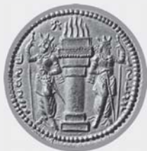
یک سکه‌ی دوره‌ی ساسانی از جنس طلا مربوط به زمان شاپور اول