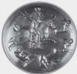
یک ظرف نقره‌ای مربوط به دوره‌ی ساسانی