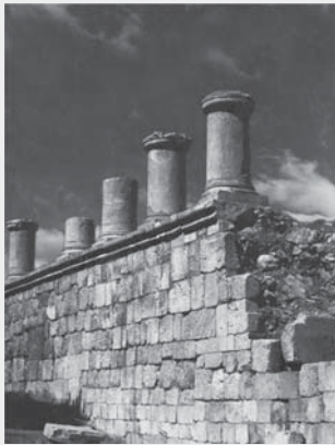
تصویری از معبد آناهیتا در کنگاور

برای افزایش پیروان مسیحیت و آیین بودا فراهم شد. موبدان زردشتی از این سیاست دینی اشکانیان ناراضی بودند. آنان عقیده داشتند که حکومت اشکانی باید از دین زردشتی حمایت کند. یکی از علل سقوط اشکانیان ناراضی‌های همین گروه از حکومت اشکانیان بود.