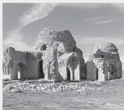
بقایای یک کاخ مربوط به دوره ساسانیان در سروستان فارس

اگرچه اردشیر بابکان بنیان‌گذار حکومت ساسانیان است. او نزد مورخان که در قرن‌های نخستین هجری می‌زیستند، پادشاهی خوش‌نام است. جد او، ساسان، موبدی زردشتی بود که ریاست معبد آناهیتا را در پارس به عهده داشت. از این رو، خاندان ساسان در پارس از نفوذ و احترام لازم برخوردار بودند. ساسان با دختر حاکم پارس، ازدواج کرد و از آن پس موقعیت اجتماعی بهتری پیدا کرد و توانست جانشین پدر زن خود شود. چندی بعد، در زمانی که خاندان اشکانی به دلیل «اختلافات داخلی» و «جنگ‌های خارجی» ضعیف شده بودند، اردشیر (نوهی ساسان) به فکر دست‌یافتن به حکومت افتاد.