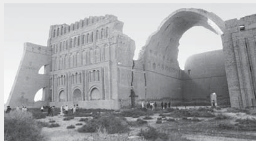
طاق کسری یا ایوان مداین مشهورترین اثر به جا مانده از عصر ساسانی است که در کشور عراق امروزی قرار دارد. این بنا در فرهنگ و ادبیات ایرانیان به عنوان مظهر ناپایداری اوضاع جهان شناخته شده است.

«قباد» وارث مشکلات بسیاری بود. البته برای حل آن‌ها تلاش کرد اما توفیق زیادی نیافت. هم‌زمان با روی کار آمدن قباد، جنگ‌های مکرر در شرق و غرب ایران ساسانیان را سردرگم کرده بود. به علاوه کشمکش با بزرگان که مدام در امور کشور دخالت می‌کردند و برای کسب قدرت با یکدیگر به رقابت می‌پرداختند، شاهان ساسانی را دچار زحمت می‌کرد. از طرفی، مالیات‌های سنگین و ستم بر مردم، پریشانی اوضاع را بدتر می‌ساخت. وقوع خشکسالی نیز بر مشکلات افزود و قباد را در وضعیت سختی قرار داد. در چنین شرایطی مزدک ظهور کرد. او خود از اشراف بود اما اندیشه‌های تازه‌ای درباره‌ی شیوه‌ی اداره‌ی کشور مطرح کرد؛ از جمله، خواهان توزیع آذوقه در میان مردم قحطی‌زده و کاهش قدرت بزرگان (فرماندهان نظامی، زمینداران و ...) بود.