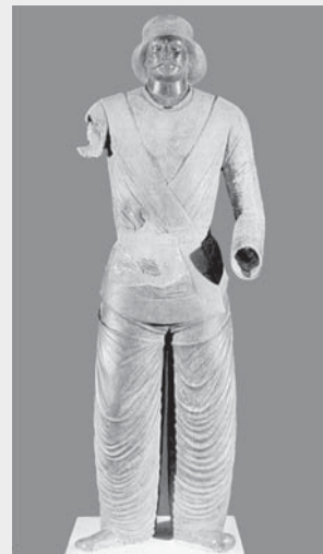
مجسمه‌ی یک مرد پارتی. این مجسمه از مهم‌ترین آثار به جا مانده از دوره‌ی اشکانی است.

در حکومت اشکانیان، قدرت و نفوذ پادشاه همچون قدرت و نفوذ پادشاهان هخامنشی نبود. حاکمان محلی از استقلال داخلی برخوردار بودند و شاه در تعیین آن‌ها نقش زیادی نداشت. در این دوره، مجلس مهستان در تصمیم‌گیری‌های مهم کشور مثل تعیین جانشین برای پادشاه یا تصمیم‌گیری برای جنگ نقش زیادی داشت. اعضای این مجلس را رهبران مذهبی، شاهزادگان، حاکمان مناطق و فرماندهان سپاه تشکیل می‌دادند. آنان املاک وسیعی داشتند و افراد زیادی را در زیر دستشان به خدمت گرفته بودند تا روی زمین‌هایشان کار کنند یا خدمات دیگری انجام دهند. در اوایل دوره‌ی اشکانیان، نفوذ فرهنگ «یونانی» در میان اشراف هنوز از میان نرفته بود. به طوری که آثار آن در شیوه‌ی زندگی، تفریحات و سرگرمی‌ها و شیوه‌ی نگارش آنان دیده می‌شد. با گذشت زمان، کشمکش و رقابت بزرگان کشور بیشتر شد، به طوری که هیچ یک از آن‌ها برتری دیگری را نمی‌پذیرفت. ادامه‌ی این وضع موجب بروز آشفتگی و هرج و مرج و در نهایت، سقوط اشکانیان شد.